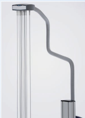
Kabelarm ergo vac LT

Mit der Elektrodenauganlage ergo vac (inkl. ergo vac LT ) führen Sie Ruhe- und Belastungs-EKG-Messungen schnell und komfortabel durch. Die ergo vac ist für alle EKG-Gerätetypen geeignet und kann an verschiedenen Wagensystemen montiert werden. Bei Bedarf bieten wir auch kundenspezifische Halterungen. ergo vac verfügt ebenfalls über eine Ausblasfunktion, um Feuchtigkeit und Verunreinigungen auszublasen.